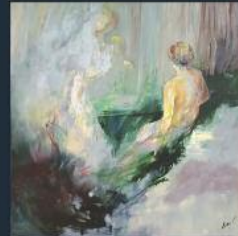
Prix de l'AEAF au salon de La Rochelle