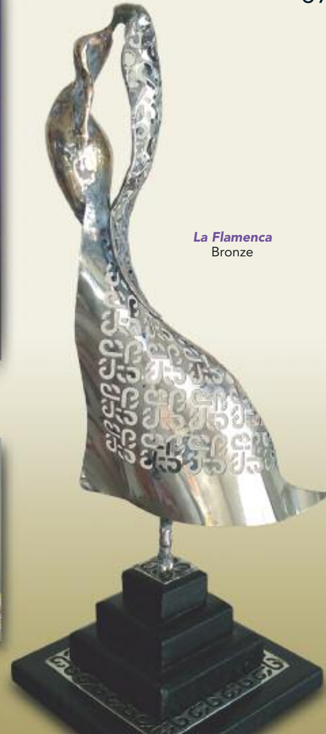
La Flamenca Bronze