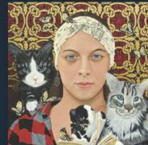
Prix de l'AEAF au salon Art Sciences Lettres