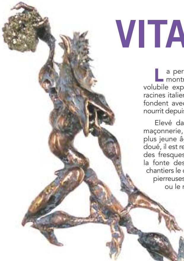
La prédatrice Bronze