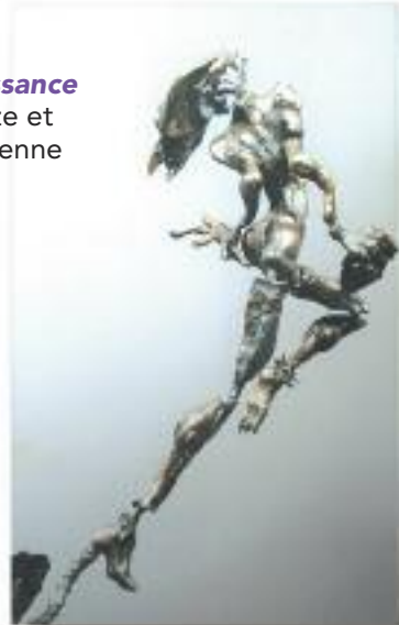
La puissance Bronze et obsidienne