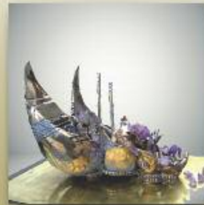
Hommage Bronze et améthyste