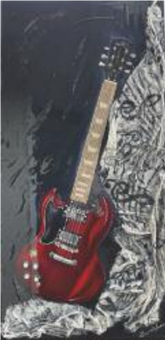
34 MATRICON Mireille Ecorce de printemps H-T